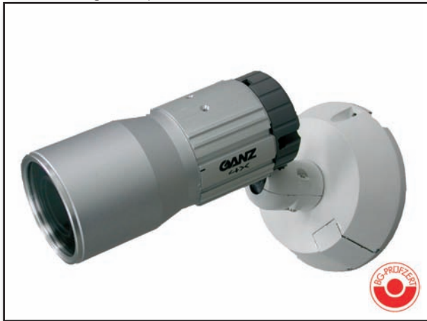
Anwendungsbeispiel mit ZCA-LB101